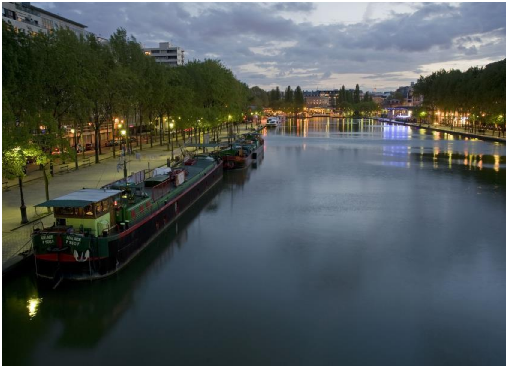
La péniche Adélaïde au Bassin de La villette Paris 75019 Face au 59 quai de la Seine