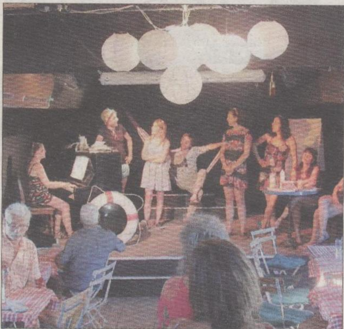
Sur la scène, acteurs, chanteurs, compositeurs et même serveurs.

sonnes au maximum) mais tous ceux qui se sont déplacés n'ont pas regretté ce moment. Des artistes complets, compositeurs en plus, qui sont partis de Paris pour rejoindre le festival d'Avignon. La tournée se terminera le 20 août.