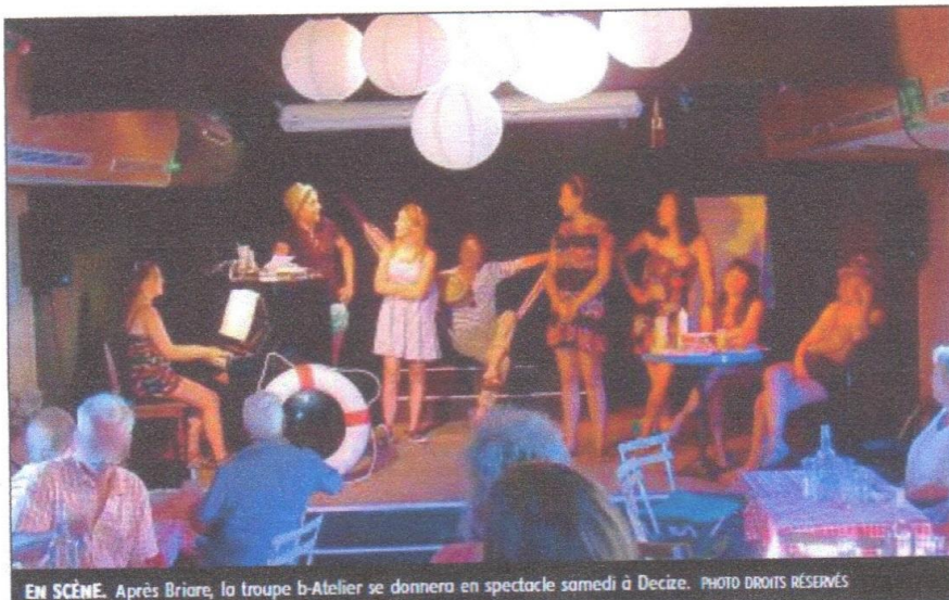
EN SCÈNE. Après Briare, la troupe b-Atelier se donnera en spectacle samedi à Decize.

Sur le même principe, la troupe b-Atelier tire, elle, son inspi-